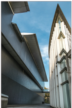
와카야마 현립박물관 & 현립근대미술관